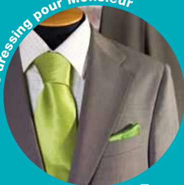
Le dressing pour Monsieur