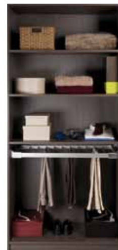
Gris de Macassar