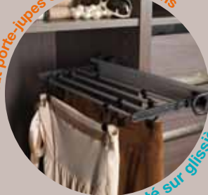
Monté sur glissière