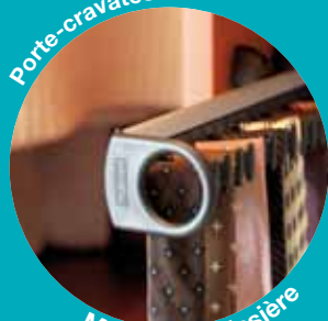
Monté sur glissière