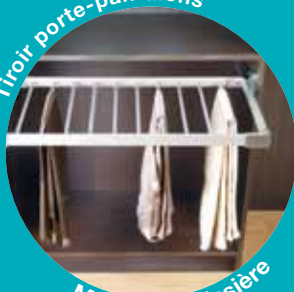
Monté sur glissière